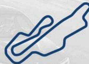
MUGELLO 3-4 Luglio