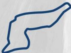
IMOLA 4-5 Settembre