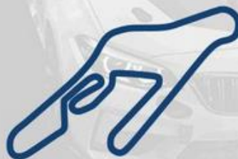
VALLELUNGA 18-19 Settembre