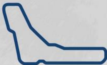
MONZA 1-2 Maggio

Le date del campionato BMW M2 CS RACING CUP ITALY 2021.