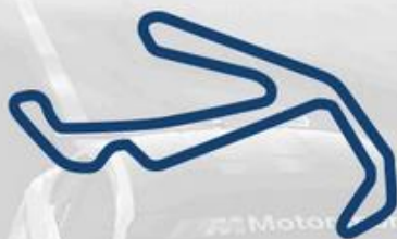
MISANO 5-6 Giugno