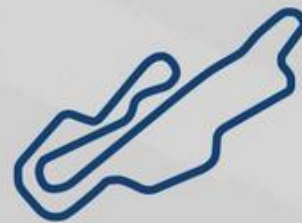
MUGELLO 9-10 Ottobre